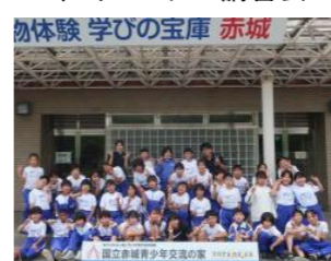
物体験 学びの宝庫 赤城