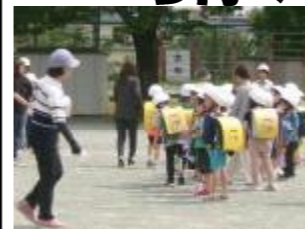
難訓練・引き渡し訓練