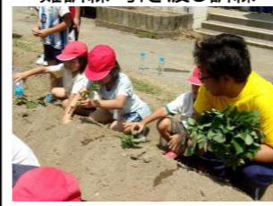
2年 サツマイモ苗植え