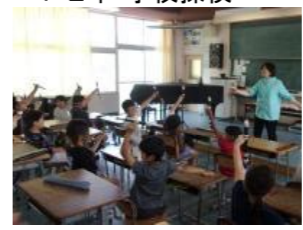
3年 リコーダー講習会